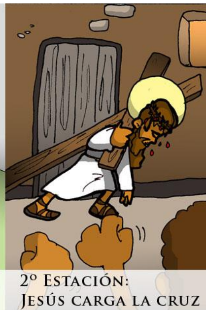
2º ESTACIÓN: JESÚS CARGA LA CRUZ