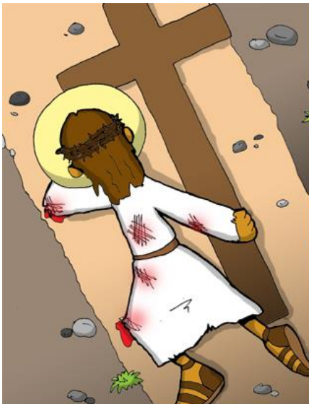
9º ESTACIÓN: JESÚS CAE POR TERCERA VEZ

Señor pequé, tened piedad y misericordia de mí.