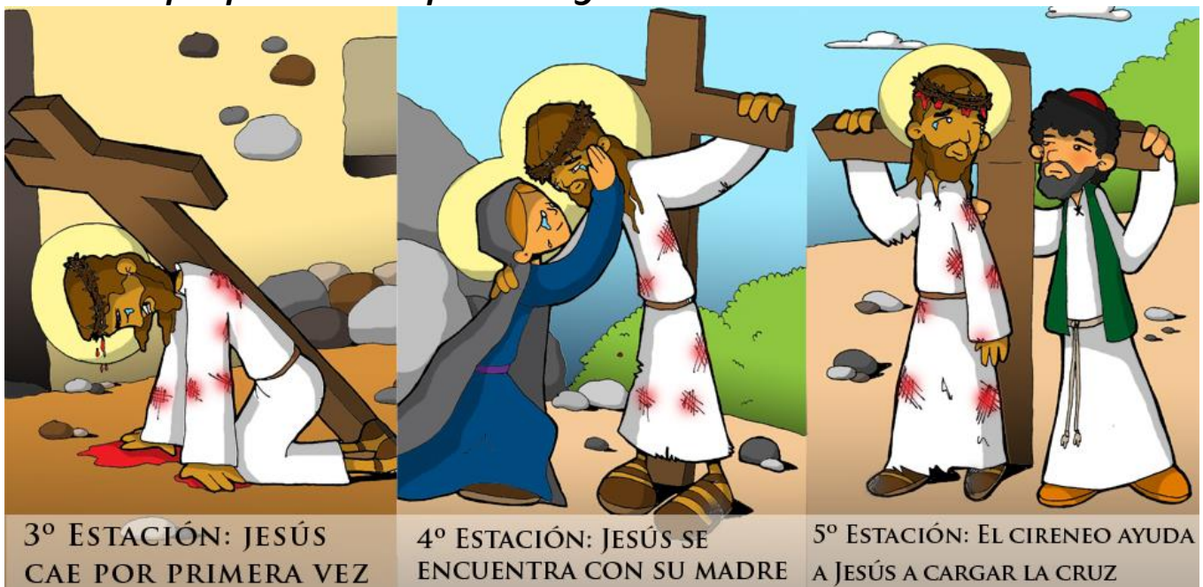
3º ESTACIÓN: JESÚS CAE POR PRIMERA VEZ

Padre nuestro que estás en el cielo... Señor pequé, tened piedad y misericordia de mí.