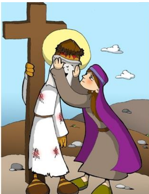
6º ESTACIÓN: LA VERÓNICA ENJUGA EL ROSTRO DE JESÚS

Padre nuestro que estás en el cielo... Señor pequé, tened piedad y misericordia de mí.