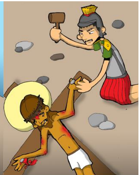
11º ESTACIÓN: JESÚS ES CLAVADO EN LA CRUZ