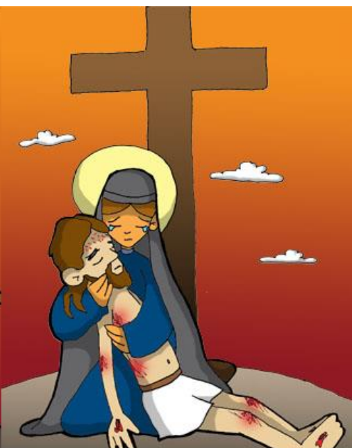
13º ESTACIÓN: JESÚS ES BAJADO DE LA CRUZ