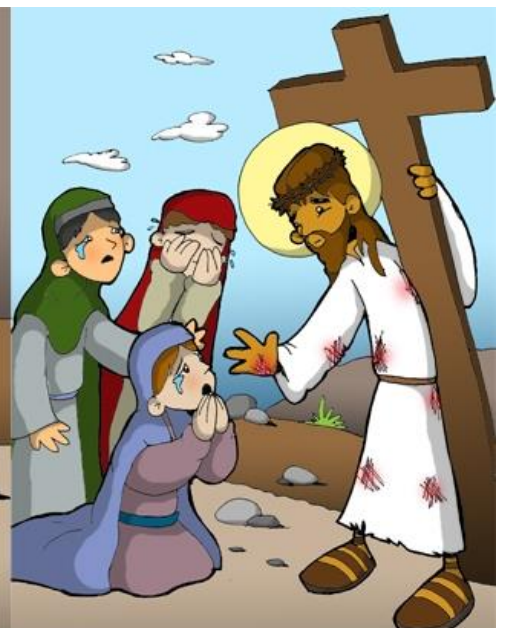
8º ESTACIÓN: JESÚS CONSUELA A LAS MUJERES DE JERUSALÉN