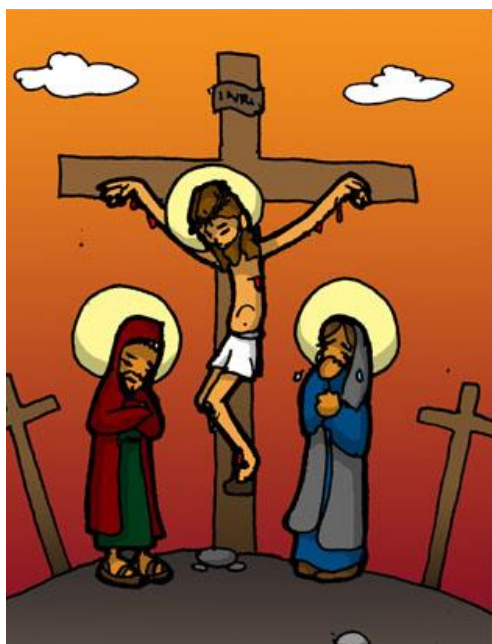
12º ESTACIÓN: JESÚS MUERE EN LA CRUZ

Padre nuestro que estás en el cielo... Señor pequé, tened piedad y misericordia de mí.