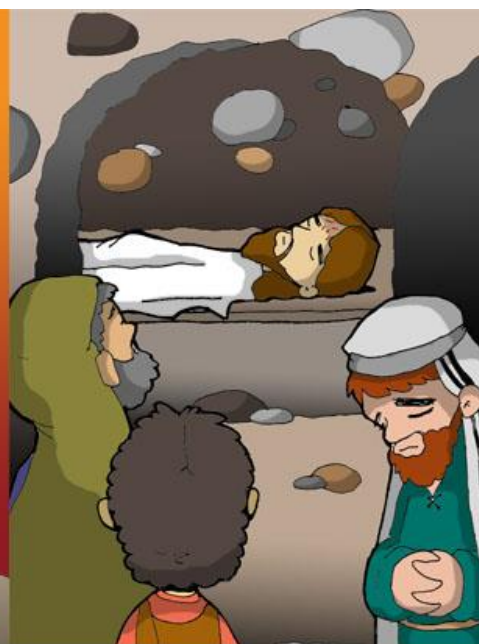
14º ESTACIÓN: JESÚS ES SEPULTADO