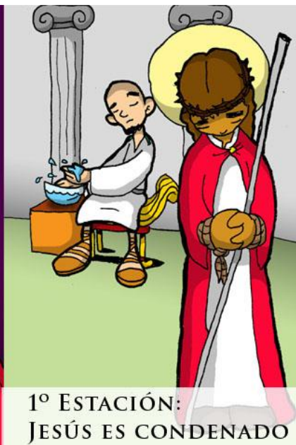
1º ESTACIÓN: JESÚS ES CONDENADO