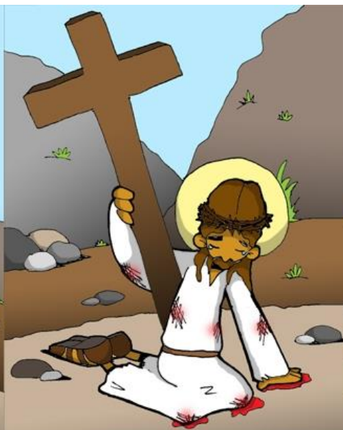
7º ESTACIÓN: JESÚS CAE POR SEGUNDA VEZ