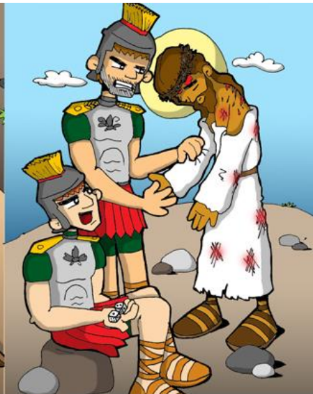
10º ESTACIÓN: JESÚS ES DESPOJADO DE SU ROPA